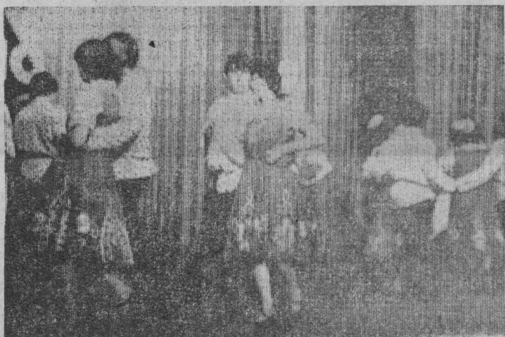
Выступает танцевальный коллектив Горьковского Дома культуры.

Впервые на районной сцене выступили самодеятельные артисты совхоза «Гурьевский». Хорошие вокальные данные, культура исполнения выделили «Селяночку» (так называется вокальная группа совхоза) в один из лучших коллективов. Хор Менчерецкого Дома