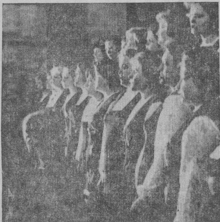
Песню времен Великой Отечественной войны «Ой, туманы мой, растуманы» исполняет хор Сосновского ДК.