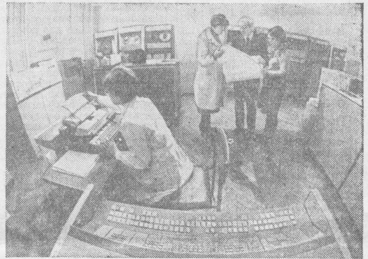
КАК ВАС ОБСЛУЖИВАЮТ?