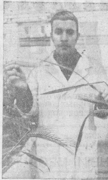
Ленинград. Всесоюзный научно-исследовательский институт растениеводства имени Н. И. Вавилова (ВИР) располагает уникальной коллекцией образцов семян (более 250 тысяч).

Постоянная комиссия СЭВ по сельскому хозяйству определила ВИР координатором пробле-