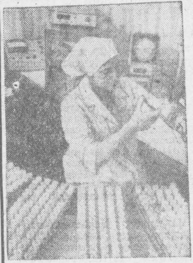
Литовский научно-исследовательский институт животноводства в Байсогале разрабатывает технологию производства кормов, наиболее эффективные рационы для животных.