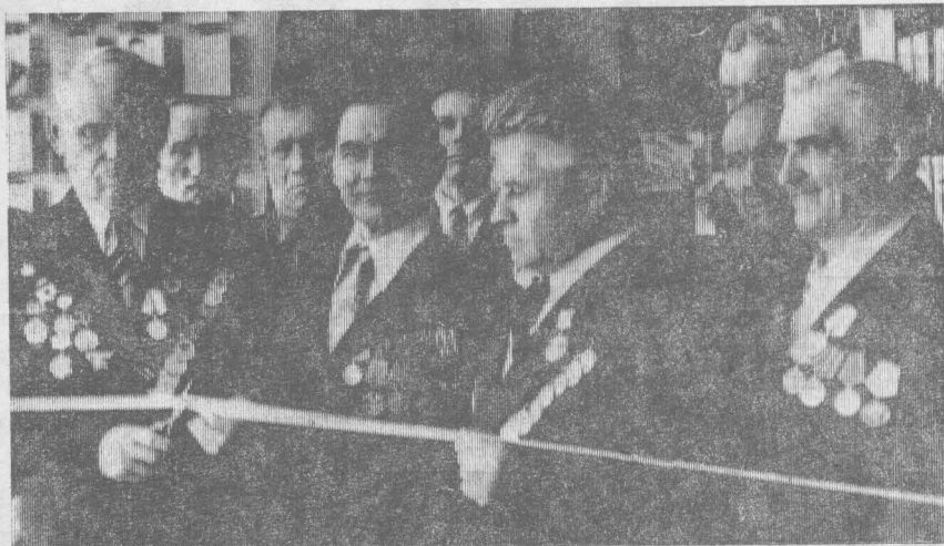
Почетное право открыть музей предоставлено ветеранам войны

Вот фотоснимки. Они запечатлели село таким, каким было оно всего несколько лет тому назад: маленькие подслеповатые домики,