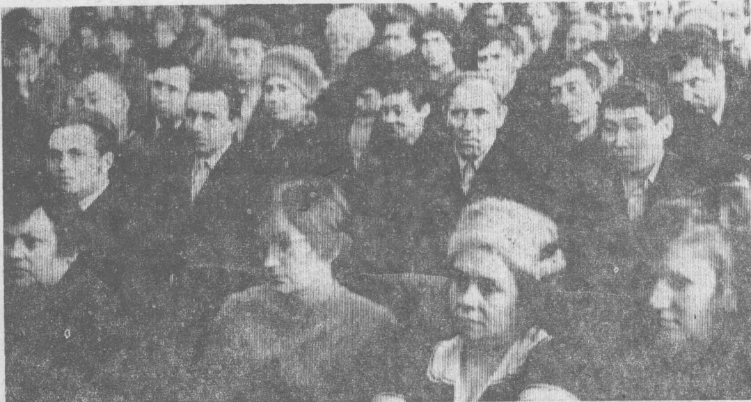
УЧАСТНИКИ ТОРЖЕСТВЕННОГО СОБРАНИЯ