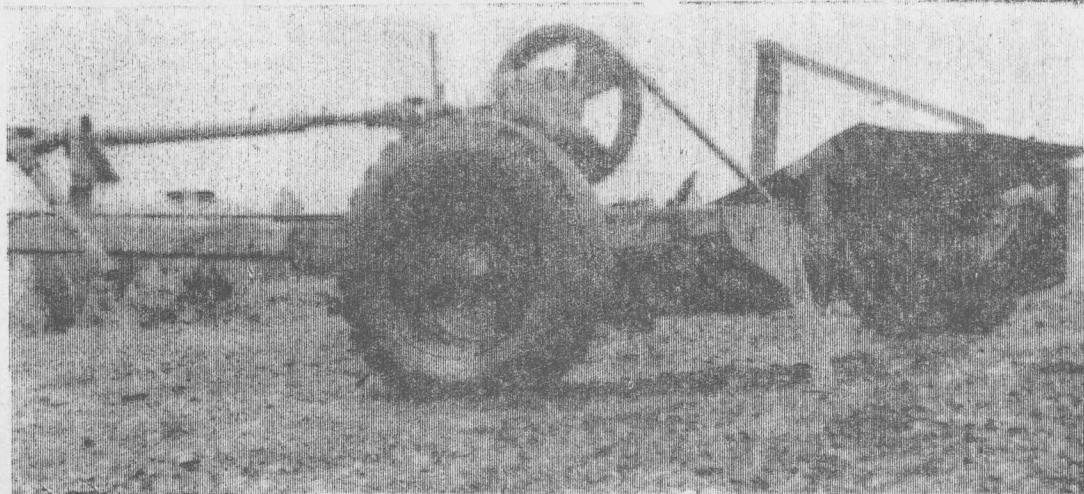
ПЕРЕОБОРУДОВАНИЕ СИЛОСОУБОРОЧНОГО КОМБАЙНА ДЛЯ КОСОВИЦЫ БОТВЫ КАРТОФЕЛЯ

ке. Для предотвращения набрасывания массы на трактор и предохранения обслуживающего персонала в случае обрыва ножей барабана, на них устанавливается защитный кожух из 4—5 миллиметрового железа на высоту 350 миллиметров относительно оси барабана. Привод рабочих органов осуществляется от вала отбора мощности трактора (ВОМ). Редуктор силосоуборочного комбайна устанавливается на площадку размером 600x400 миллиметров из 5-миллиметрового