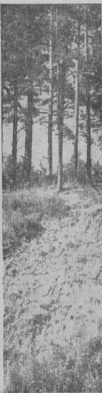
СКОРО ОСЕНЬ.