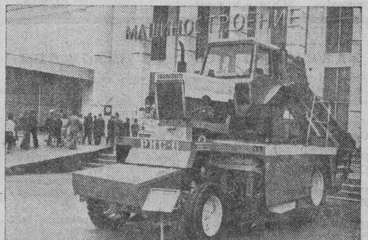
МОСКВА. На ВДНХ СССР открыта выставка-смотр «Достижения изобретателей и рационализаторов Днепропетровской области».

НА СНИМКЕ: самоходная шестирядная корнеуборочная машина РК-6 Днепропетровского комбайнового завода имени К. Е. Ворошилова.