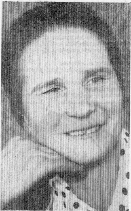
◆ Их труд отмечен Родиной