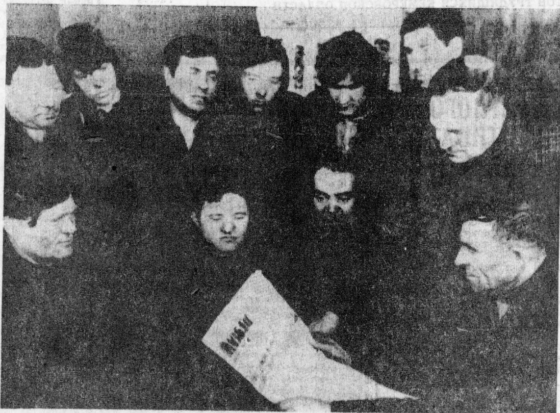
В коллективе РТМ совхоза «Родина» идет обсуждение постановления ЦК КПСС «О 60-й