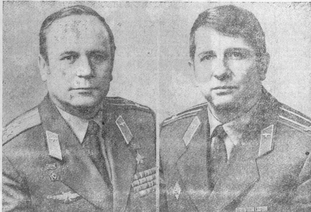
Командир космического корабля «Союз-24» летчик-космонавт СССР, Герой Советского Союза полковник Виктор Васильевич Горбатко