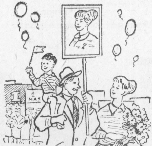
В ПРАЗДНИЧНОЙ КОЛОННЕ

— Я же говорил, что буду носить тебя на руках.