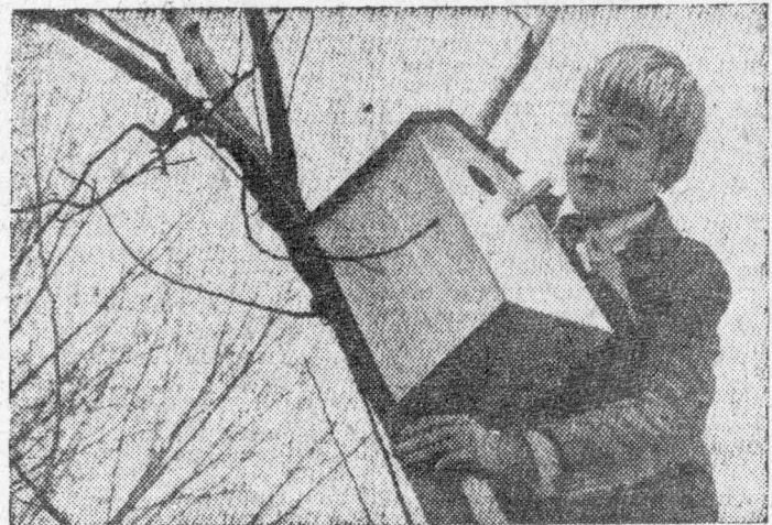
На снимке: ждем вас, скворцы!

Страшнейшим вредителем картофеля являются личинки колорадского жука. Птицы, живущие в средней полосе нашей страны, эти личинки не поедают. Но зато почти «делкатесом» они стали для скворцов.