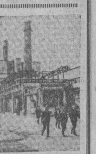
МАРИНСКАЯ АССР. В городе Волжске вступил в строй действующих крупный гидротехнический завод. Его мощность тридцать тысяч тонн продукции в год. Белые двойки вальцовки ценной добавкой в кормовую рацию сена и травы. Стекает повышенно продуктивно. НА СНИМКЕ: общий вид гидротехнического завода.

ЦВЕТКОВ И П. Пасека «Человек-любитель». Издание второе, доп. исправл. М., Россельхозиздат, 1974. «Справочник для поступающих в средние специальные учебные заведения СССР в 1975 году». М., «Высшая школа», 1975.