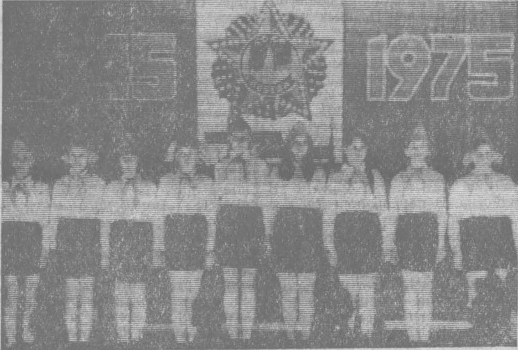
УЧАСТНИКОВ ЗАСЕДАНИЯ ПРИВЕТСТВУЮТ ПИОНЕРЫ

Что же в конечном итоге остановило врага под Москвой, что позволило начать контрнаступление? Конечно, исторически сложившийся свободолюбивый характер русских людей, людей всех национальностей, объединенных одним понятием—страха Советов. И опять-таки—наша экономика, гибкая, стремительная в своем развитии, социалистическая.