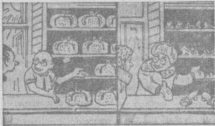
Летом закидали шапками, а зимой — босоножками и тапками.