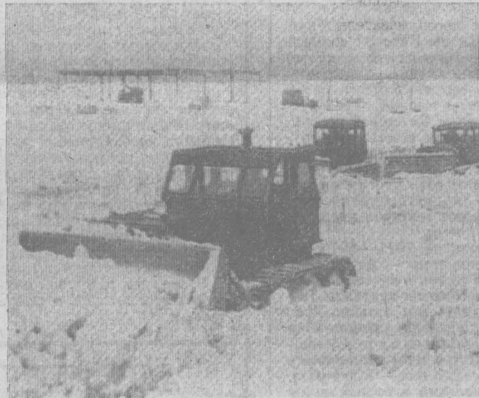
Идет расчистка территории для новых объектов.