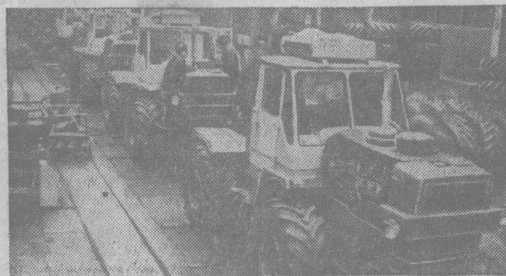
Коллектив Харьковского тракторного завода имени С. Орджоникидзе приступил к изготовлению первой в нынешнем году партии мощных колесных тракторов «Т-150», предназначенных для районов Нечерноземья.