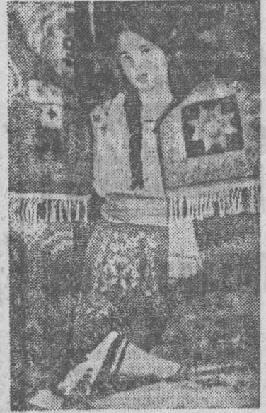
Изделия ковроделов Комратской фабрики (Молдавия) пользуются широкой известностью в нашей стране и за рубежом.

23 наименования ковров, выпускаемых фабрикой, отмечены государственным знаком качества.