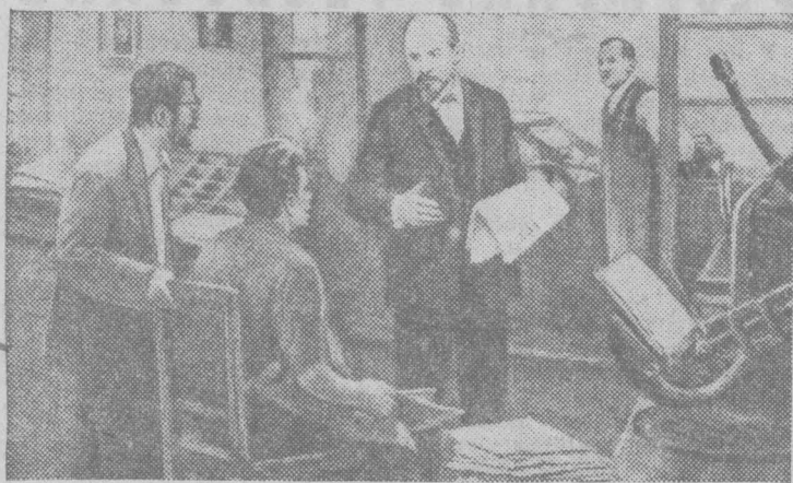
«Искра». Картина художника Д. Налбандяна.

24 ДЕКАБРЯ — 75 ЛЕТ СО ДНЯ ВЫХОДА (1900) ПЕРВОГО НОМЕРА ОБЩЕРУССКОЙ НЕЛЕГАЛЬНОЙ МАРКСИСТСКОЙ ГАЗЕТЫ «ИСКРА»