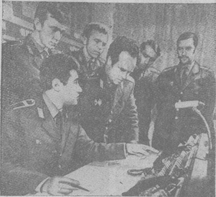
ГОРЬКИЙ. Юристов высшей квалификации — работников ОБХСС готовит Горьковская высшая школа МВД СССР.

Будущие офицеры советской милиции изучают марксистско-ленинскую философию, законодательство, специальные дисциплины, получают всесторонние экономические знания. Теоретическое обучение сочетается с практикой и стажировкой в аппаратах ОБХСС.