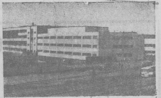
В Красноярске сооружается завод автомобильных и тракторных прицепов и полуприцепов. Сейчас монтируется оборудование во вспомогательных цехах, возводятся корпуса металлургического производства. В этом году намечено выпустить первую опытную партию. НА СНИМКЕ: на строительстве корпуса вспомогательных цехов.

Дни выхода вторник, четверг, суббота Цена 2 коп.