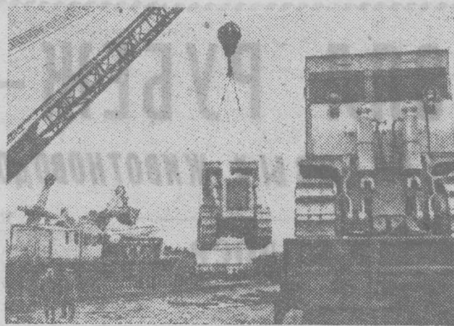
ИРКУТСКАЯ ОБЛАСТЬ. Непрерывным потоком идут через Байкал грузы для строящейся Байкало-Амурской магистрали. Из порта Байкал к мысу Курлы на севере озера по воде доставляются техника, строительные материалы, сборные щитовые дома. Для транспортировки грузов построены специальные теплоходы и баржи.

Высокий, четкий темп прокладки БАМа во многом — результат заботы об этой крупнейшей стройке всей страны. Сотни предприятий всех союзных республик готовят технику, оборудование, поставляют материалы для бригад, прокладывающих стальную трассу через суровую тайгу, болота, горные хребты. Большинство заказов для БАМа коллективы