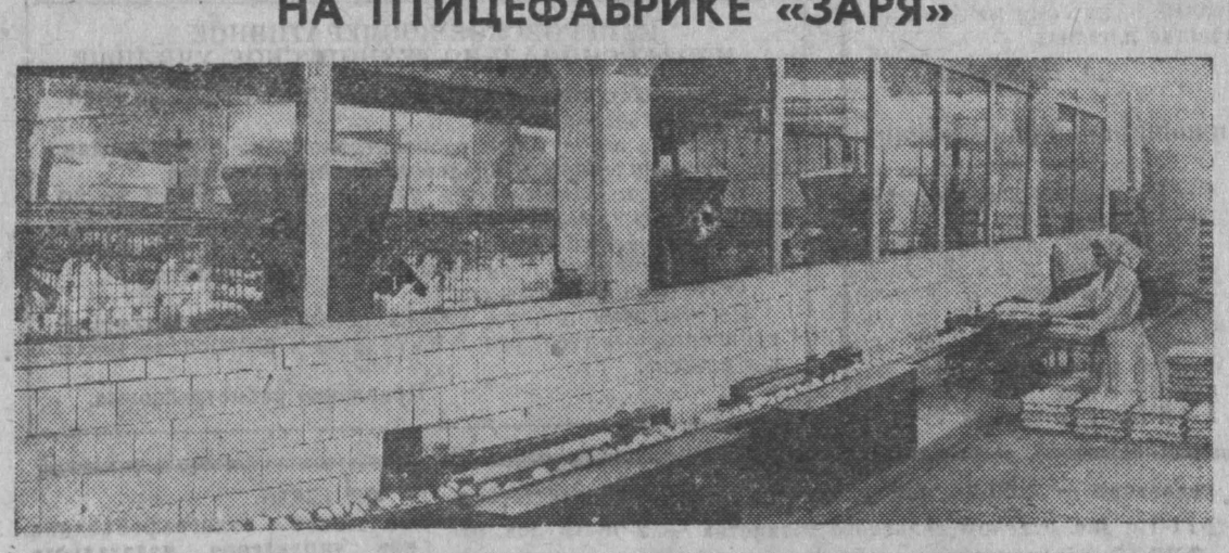
НА ПТИЦЕФАБРИКЕ «ЗАРЯ» Красноярский край. Соревнуясь в честь XXV съезда КПСС, коллектив птицефабрики «Заря» обязался выполнить план завершающего года пятилетки к 7 ноября. «Заря» — это одно из самых прибыльных предприятий Красноярского треста «Птицепром». В прошлом году она дала около четырех миллионов рублей прибыли. Хорошие результаты и за истекшее полугодие: произведено около трех миллионов штук яиц и 298 тонн мяса. Успехов удалось добиться за счет высокого уровня механизации и автоматизации производственных процессов, использования высокопродуктивных пород птиц. На снимке: один из цехов фабрики.