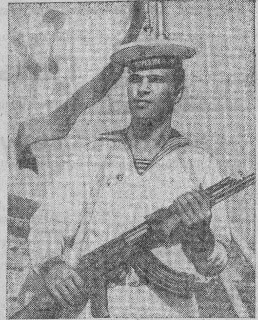
Почетная вахта (Краснознаменный флот).

Сегодня и завтра — массовый выход рабочих, колхозников, служащих, учащихся, трудящихся городов и рабочих поселков на сенокос. Добиться высокой производительности, внести весомый вклад в накопление кормов для скота — дело чести и святая обязанность каждого.