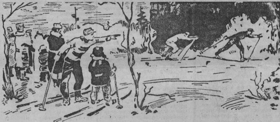
В зимний день.