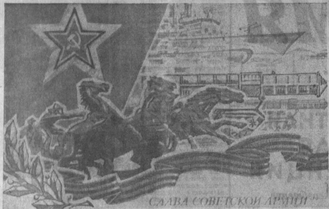
СЛАВА СОВЕТСКОЙ АРМИИ