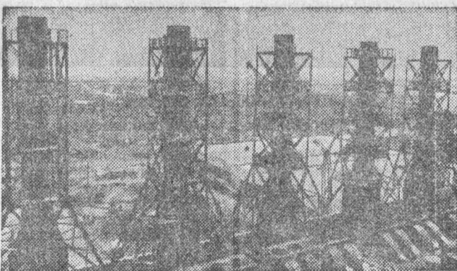
КЕМЕРОВСКАЯ ОБЛАСТЬ. В поселке Притомском сооружена самая мощная в Сибири Осинниковская центральная углеобогатительная фабрика. Проектная мощность ее — 5 миллионов 600 тысяч тонн топлива в год. НА СНИМКЕ: центральная углеобогатительная фабрика.