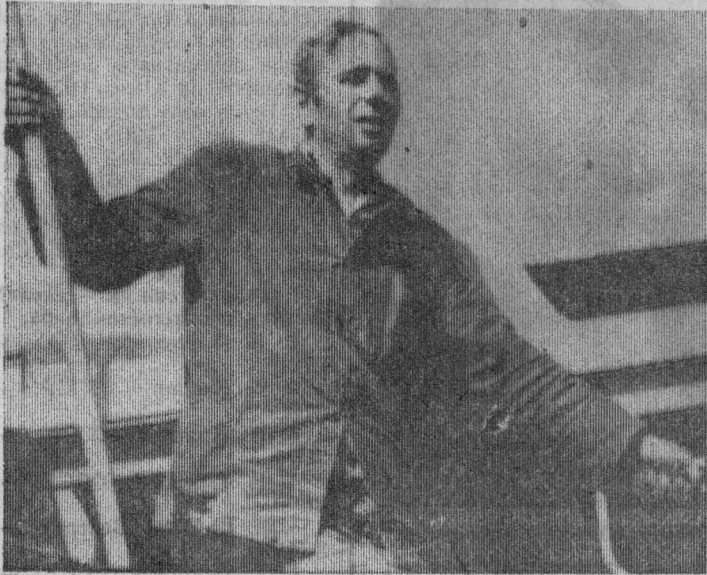
Машинист экскаватора 423