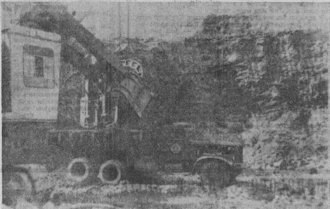
Идет погрузка угля.