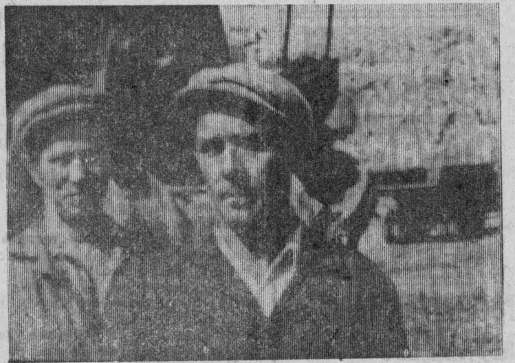
Экипаж экскаватора 4235.