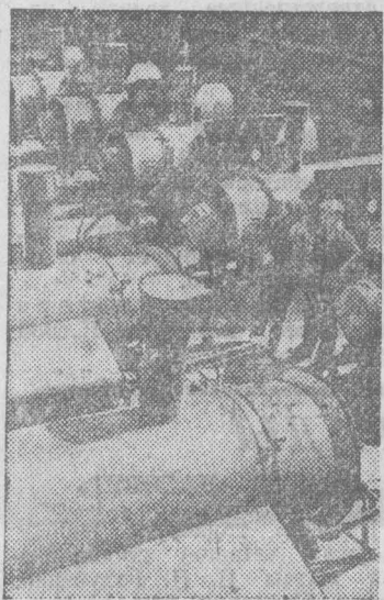
На новгородском электровакуумном заводе освоены выпуск воздушонагревателей «ВНТ-400», применяемых для сушки зерна на складах колхозов и совхозов. За шесть месяцев хозяйствам области отгружено свыше 50 агрегатов. До конца года их будет изготовлено еще 50.

● Создать нормальные условия труда, быта и отдыха труженикам полей.