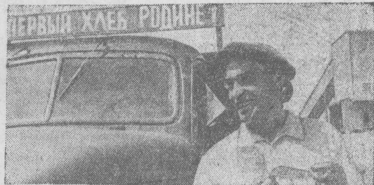
ОДЕССКАЯ ОБЛАСТЬ. Продажу хлеба государству продолжают земледельцы области. На элеваторы, хлебопри-

емные пункты поступает зерно нового урожая.