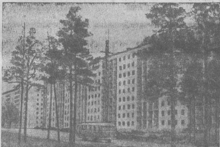
НОВОСИБИРСК. В нескольких километрах от Академгородка в Правых Чомах идет строительство города-спутника. Здесь создаются специализированные конструкторские бюро и экспериментальные производства Сибирского отделения Академии наук СССР.

Опыт колхоза «Кокнесе» Стучинского района широко распространяется в республике. Уже во многих хозяйствах завели паспорта на каждое хранилище сенажа и оплачивают труд людей, занятых уборкой трав, в зависимости от количества и качества заготовленных ими кормов.