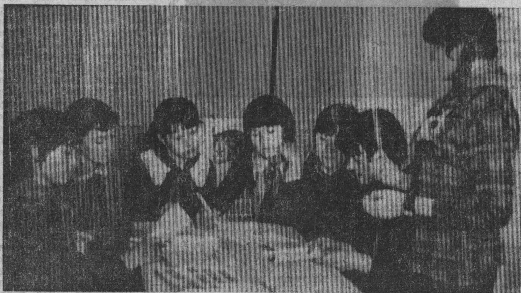
На очередном заседании совета дружины.

Решением совета пионерская дружина Старо-Пестеревской средней школы признана правофланговой. Сегодня о ней наш рассказ.