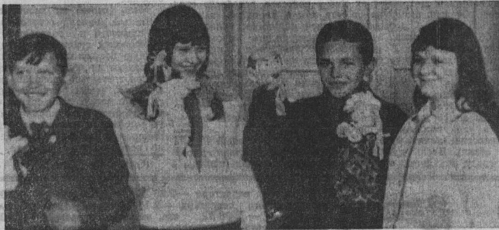
А эти веселые ребята — из школьного кукольного кружка.

Лишь о немногих делах старопестеревских ребят рассказали мы на этой странице. А сколько интересных начинаний на их счету: пионеры школы ведут большую работу по сбору материала из истории своей пионерской организации, пишут летопись села, шефствуют над малышами и престарелыми, трудятся, отдыхают.