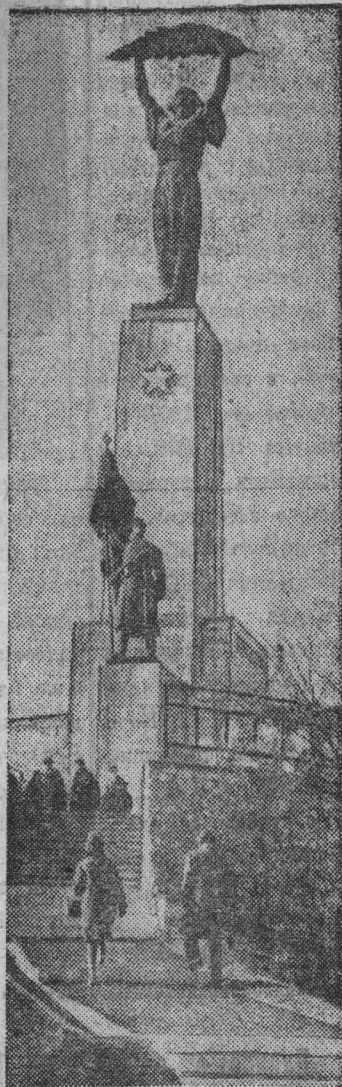
У монумента Освобождения на горе Геллерт в Будапеште. На его доколе вырезаны имена героев, отдавших свою жизнь в боях за венгерскую столицу.

4 апреля — День освобождения Венгрии от фашистских захватчиков (1945 г.)