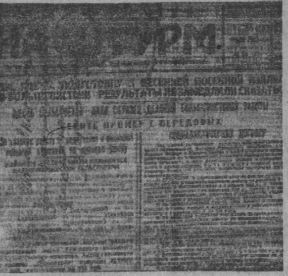
Один из номеров газеты «За штурм». Март 1932 г.