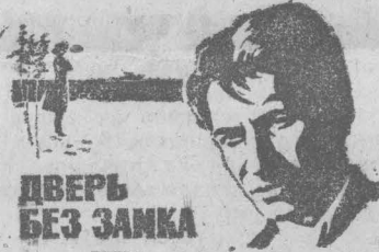
ДВЕРЬ БЕЗ ЗАМКА