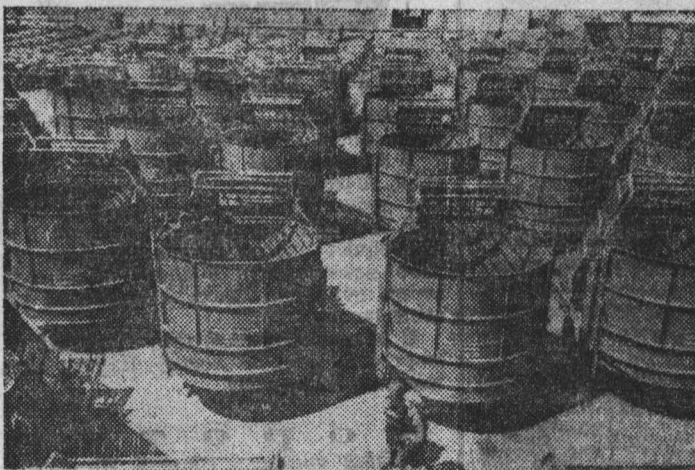
КУИБЫШЕВСКАЯ ОБЛАСТЬ. Раздатчик кормов на свиноводческих комплексах РКС-3000 и измельчитель кормов «Волгарь-5» производства завода «Сызраньсельмаш» уже давно пользуются доброй славой, удостаивались медалей выставок.

К серийному производству установки приступает завод «Ригалесмаш».