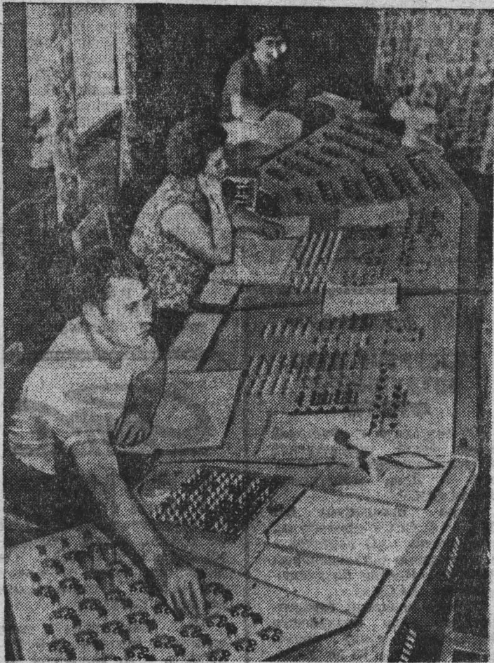
УЛЬЯНОВСК. Досрочно завершили полугодовое задание по грузообороту железнодорожники Ульяновского отделения Куйбышевской железной дороги. Раньше срока выполнен ими и план по отправлению грузов.

Коллектив отделения доставляет различные детали и оборудование на новостройку девятой пятилетки — Камский автомобильный завод.