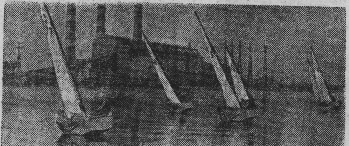
МОЛДАВСКАЯ ССР. На Кучурганском лимане создана база для занятий водно-парусным спортом. Здание яхт-клуба построено рабочими Молдавской ГРЭС. Недавно закончено строительство эллинга.

Около ста спортсменов, работающих на ГРЭС и в поселке Днестровск, получили возможность круглый год проводить тренировки и соревнования на своей базе. Водники Днестровска являются чемпионами республики по парусному спорту.