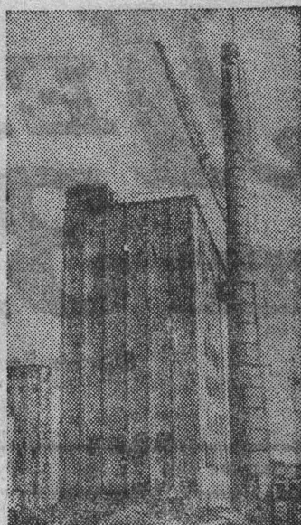
УКРАИНСКАЯ ССР. В Виннице заканчивается сооружение крупного хлебокомбината. Уже готов к приемке зерна нового урожая элеватор емкостью 29 тысяч тонн. К концу года должно быть завершено строительство мельницы производительностью 320 тонн высококачественной муки в сутки и комбинированного завода, который будет ежедневно выпускать 300 тонн комбикормов.

В отдельных хозяйствах не готовятся к заготовке витаминного сена, разукомплектованы прошлогодние установки. Нужно немедленно все восстановить и доведенное задание обязательно выполнить. Следует помнить, что нам не нужны корма «любой ценой». Например, себестоимость центнера сена в совхозе «Бачатский» составляет 3,36 рубля, колхозах им. Ильича — 3,86 им. 21 партсъезда — 6 рублей 61 коп. Это очень дорогое сено. Для сравнения: в совхозе «Рассвет» оно стоит 1 руб. 40 коп. в «России» — 1 руб. 31 коп. В 1972 году району пред-