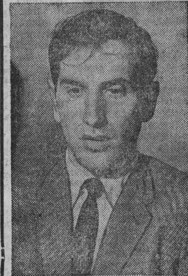
НА СНИМКЕ: Роберт Фишер.