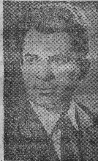
НА СНИМКЕ: Борис Спасский.

Матч состоит из 24 партий и будет продолжаться, пока один из противников не наберет 12,5 очка. Если матч закончится вничью, Борис Спасский сохранит титул чемпиона мира.