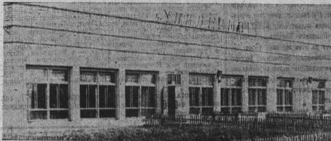
НА СНИМКЕ: универсам в поселке Старо-Бачаты.

Исполком районного Совета потребовал от государственной приемочной комиссии устранить отмеченные выше недостатки.