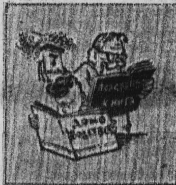
Подготовка к экзаменам. Рис. В. ЧЕРНИКОВА.