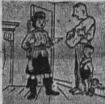
— Итак, я пошла на охоту. Вернусь завтра. Не скучай.