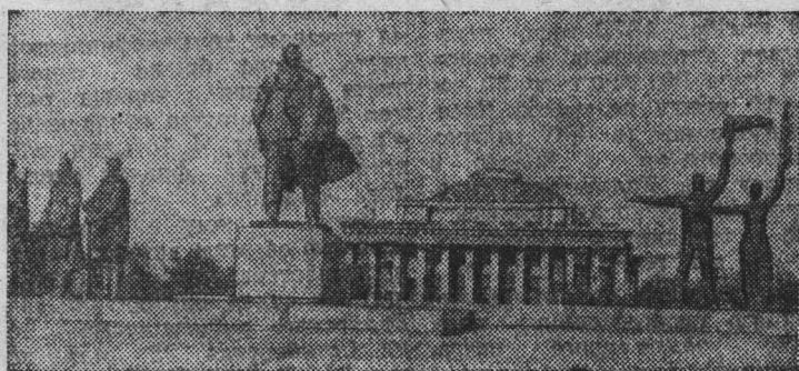
Новосибирск — крупный промышленный, научный и культурный центр страны с населением более миллиона человек.