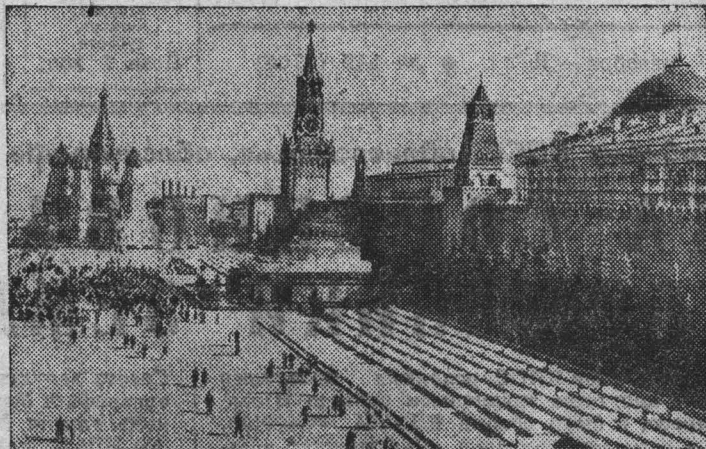
Москва, Красная площадь.

Российская республика носит название Федеративной. В. И. Ленин разработал основы Российской Федерации. В написанной им «Декларации прав трудящегося и эксплуатируемого народа» заявлено: «Советская Российская республика учреждается на основе свободного союза свободных наций как федерация Советских национальных республик». Сегодня все автономные республики и области, все национальные округа добились небывалого расцвета экономики и культуры.