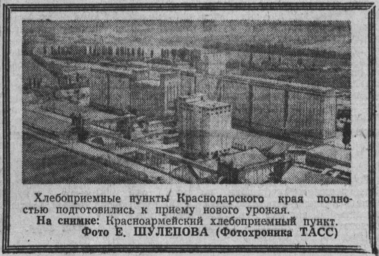
Хлебоприемные пункты Краснодарского края полностью подготовились к приему нового урожая. На снимке: Красноармейский хлебоприемный пункт.

Постановлением ЦК КПСС и Совета Министров СССР, сказал в заключение Н. В. Краснов, намечена четкая и ясная программа действий. Впереди много больших важных дел по дальнейшему развитию и совершенствованию высшего образования в стране.