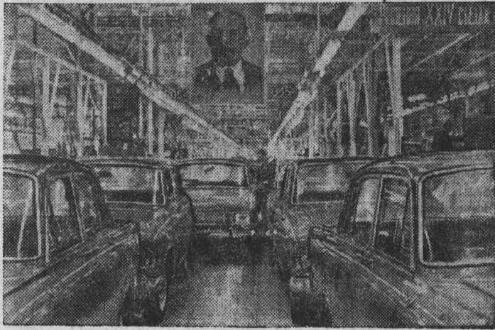
Коллектив московского автомобильного завода имени Ленинского комсомола, соревнуясь за достойную встречу 50-летия образования СССР, постоянно наращивает темпы производства.