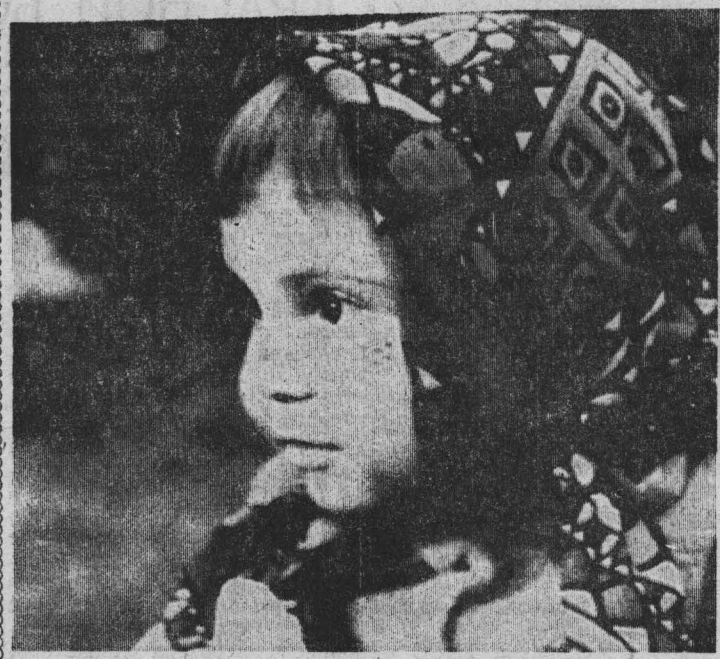
А что там такое?