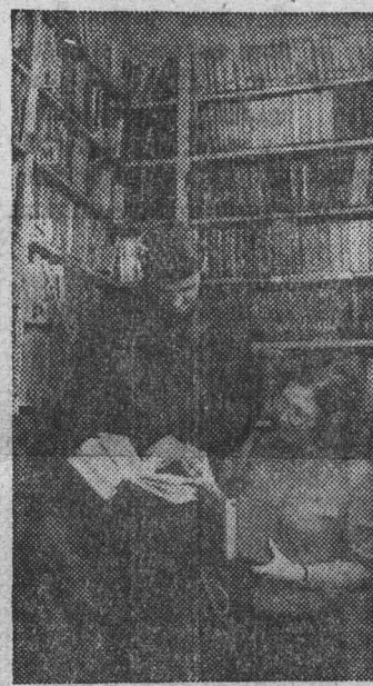
На фанерном заводе «Латвийский берез» — одном из лучших предприятий деревообрабатывающей промышленности в Латвийской ССР — многие работники цехов и отделов учатся в вечерних школах, заочных отделениях средних и высших учебных заведений.