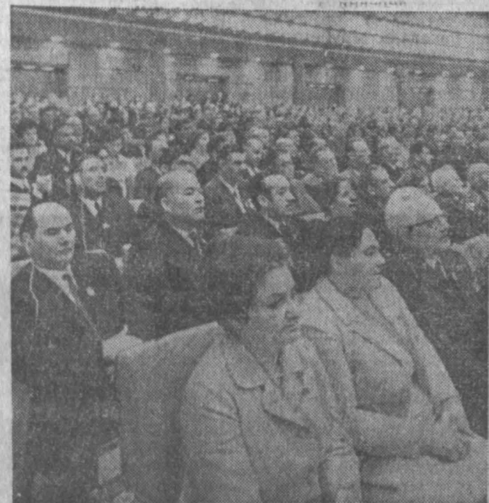
МОСКВА. XXIV съезд КПСС. НА СНИМКЕ: в зале Кремлевского Дворца съездов во время заседания.