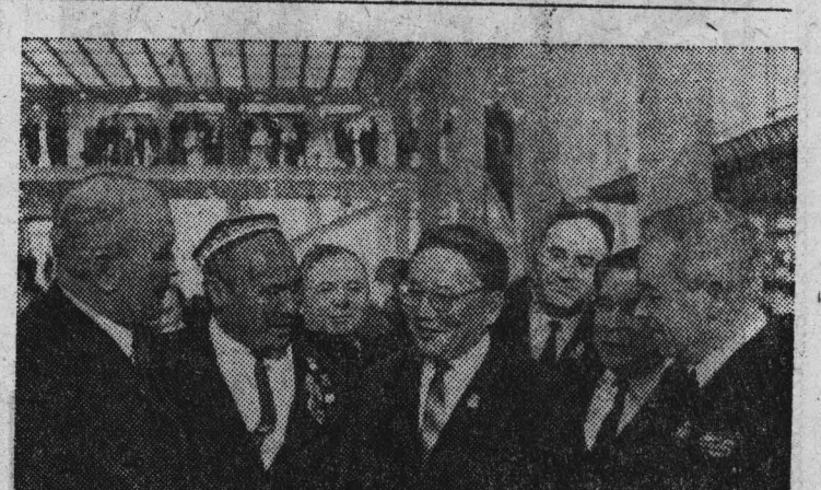
Москва. XXIV съезд КПСС. На снимке: Первый секретарь ЦК МНРП, Председатель Совета Министров МНР Ю. Цеденбал среди делегатов съезда.

Новая пятилетка открывает широкие перспективы и