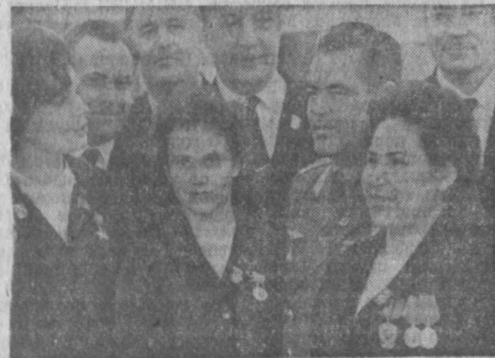
МОСКВА. XXIV съезд КПСС. НА СНИМКЕ: летчик-космонавт СССР Герой Советского Союза В. В. Николаев-Терешкова и дважды Герой Советского Союза генерал-майор авиации А. Г. Николаев с делегатами съезда.

Вот она, типичная веснянка распутица! Нам «ЗИЛ», накружено гуля, с трудом пробирается по раскисшей проселочной дороге. Порой лужи почти полностью скрывают скаты.