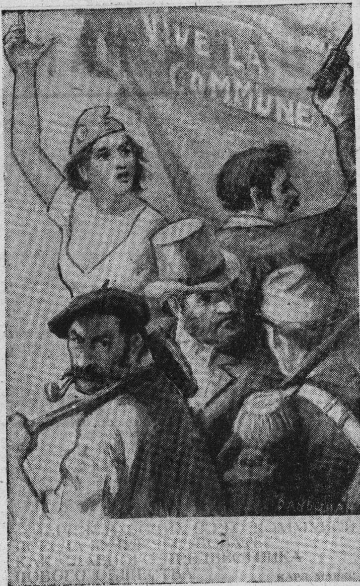
Париж рабочих с его Коммуной всегда будут чествовать как славного предвестника нового общества.