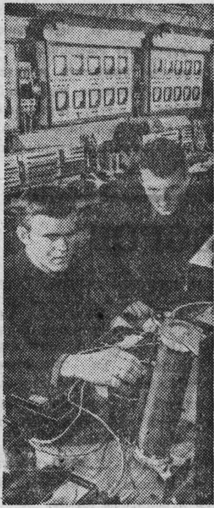
Костромской лесомеханический техникум — один из старейших в стране.

Около полутора тысяч юношей и девушек готовятся здесь стать технологами лесозаготовительного производства, механиками лесосплава и деревообработки.