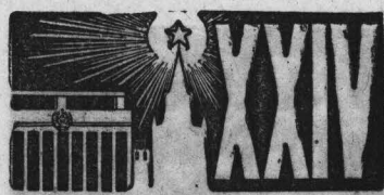
Обсуждаем проект Директив XXIV съезда КПСС