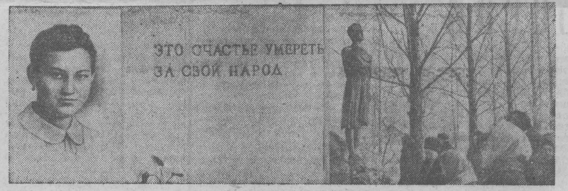
29 ноября 1971 года исполняется 30 лет со дня гибели партизанки, комсомолки, Героя Советского Союза Зои Космодемьянской. На снимках: стенд, открывающий экспозицию музея Зои Космодемьянской.

Правление Беловского райпотребсоюза приглашает на работу: экономистов, бухгалтеров, продавцов, грузчиков. Обращаться в отдел кадров райпотребсоюза, ул. Красноармейская, 86-а.