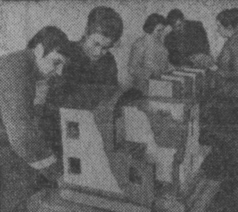
Брянская областная школа мастеров сельского строительства подготовила около трех тысяч специалистов...