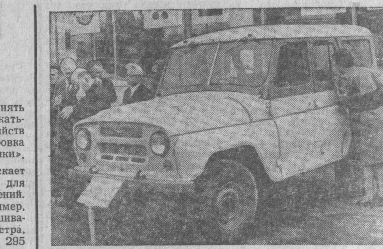
МОСКВА. На Выставке достижений народного хозяйства СССР демонстрируются несколько новых моделей автомобилей, приспособленных для движения по всем видам дорог и в условиях бездорожья. Одна из них — грузопассажирский автомобиль «УАЗ-469-Универсал», вмещающий семь человек или 600 килограммов груза. Он может также буксировать прицеп грузоподъемностью 850 килограммов. По сравнению со своими предшественниками «УАЗ-469-Универсал» имеет более мощный и экономичный двигатель, отличается большей проходимостью.

Человек — существо, постоянно развивающееся, постоянно познающее. Он имеет душу, он имеет совесть, он имеет сердце. Он имеет право на жизнь, он имеет право на труд, он имеет право на отдых, он имеет право на любовь, он имеет право на уважение, он имеет право на свободу, он имеет право на счастье. Он имеет право на все, что есть в жизни. Он имеет право на все, что есть в душе. Он имеет право на все, что есть в сердце. Он имеет право на все, что есть в жизни. Он имеет право на все, что есть в душе. Он имеет право на все, что есть в сердце. Он имеет право на все, что есть в жизни. Он имеет право на все, что есть в душе. Он имеет право на все, что есть в сердце. Он имеет право на все, что есть в жизни.