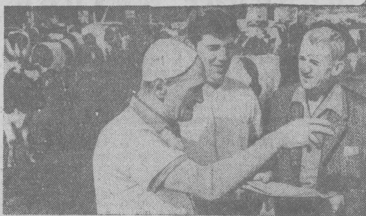
В Германской Демократической Республике после разгрома гитлеровского фашизма у крупных земледельцев, на-

А. МЕДВЕДЕНКО, корреспондент ТАСС. Сантьяго.