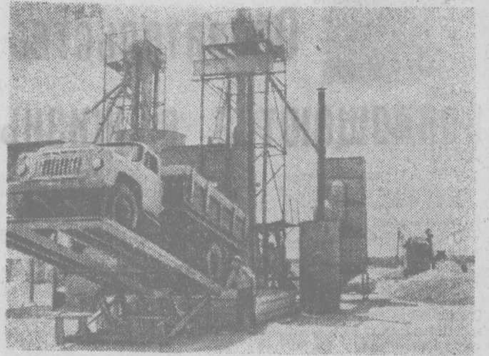
Крымская область. Хороший урожай зерновых выращен в колхозе «Россия» Джанкойского района.

На снимке: машины, наполненные зерном, приходят на механизированный ток и через минуту, уже разгруженные, снова уходят в поле к комбайнам.