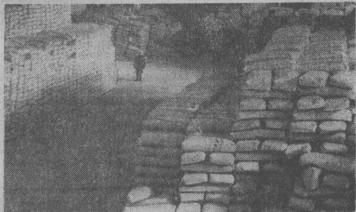
ИРКУТСКАЯ ОБЛАСТЬ. Ангарский азотно-туковый завод — один из крупнейших в стране. Его продукция — аммиачная вода, аммиачная селитра и мочевина — ежедневно отправляется в колхозы и совхозы Сибири и Дальнего Востока. Недавно здесь пущен в эксплуатацию крупный цех гранулированной мочевины.