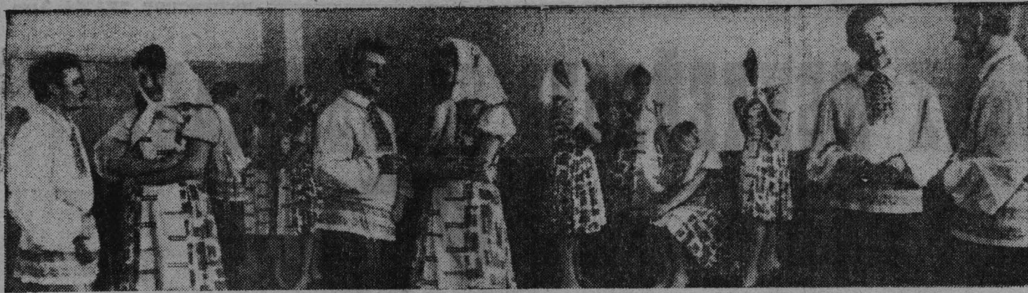
Ставропольский край. При Благодарненской межколхозной культпросветшколе создан ансамбль «Заряна». Самодеятельные артисты часто выступают на сценах сельских Дворцов культуры и клубов. На снимке: участники танцевального коллектива ансамбля.