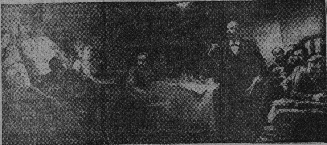
Справа — картина художника Ю. Виноградова: Второй съезд РСДРП.