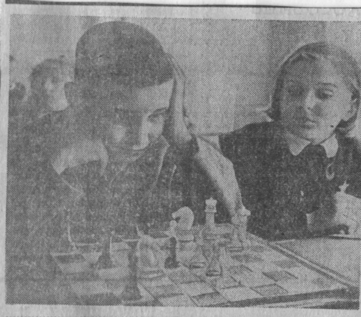
Давно известно, что шахматы развивают умственные способности, что шахматное мышление сходно математическому. В Воронежской области в третьих классах 70-й средней школы введен урок шахмат. Проводится он как эксперимент — один раз в неделю.