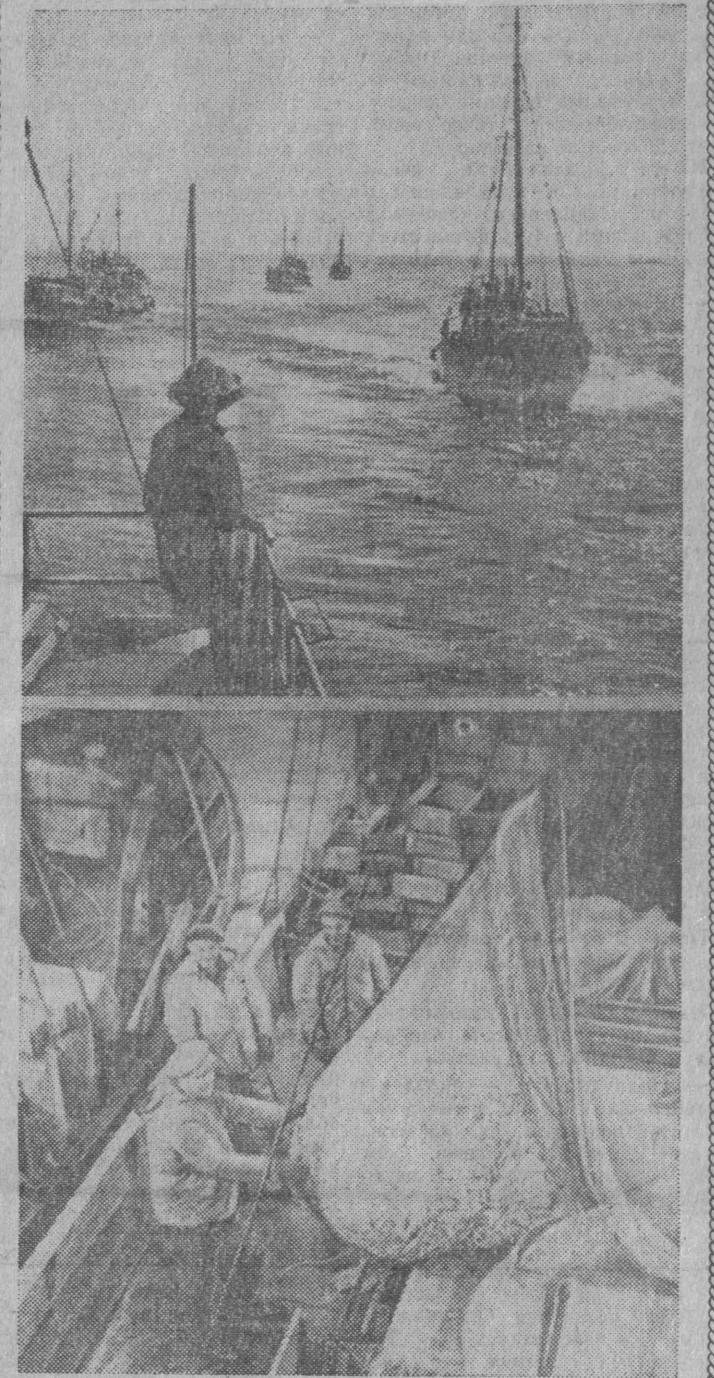
В воскресенье 14 июля советский народ чествует труя рыбаков и всех работников рыбной промышленности, сжегено дающих к столу советских людей десятки миллионов центнеров рыбы.

За годы Советской власти рыбная промышленность превратилась в крупнейшую отрасль народного хозяйства страны. Она оснащена самой крупной в мире флотилией больших морозильных и рыбообрабатывающих судов. Мощная материально-техническая база позволяет советским рыбакам добывать рыбу во многих районах Мирового океана. Большое внимание уделяется расширению рыболовства и рыбодовства во внутренних водоемах страны.